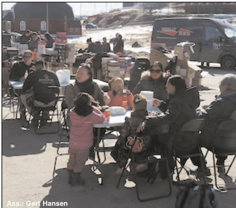
Ass.: Gert Hansen

www.kujataamiu.gl • mail: kujataamiu@gmail.com